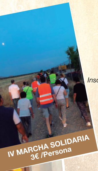
IV MARCHA SOLIDARIA 3€ /Persona

Después de la Santa Misa, se obsequiará a todos los asistentes con un refresco popular a cargo de la Esclavitud de la Virgen en colaboración con el Ayuntamiento de Cobisa.